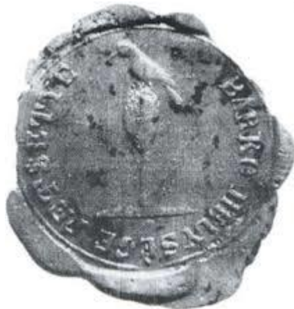
Pečat obce Brekov