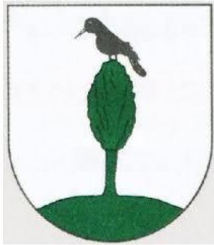
Erb obce Brekov